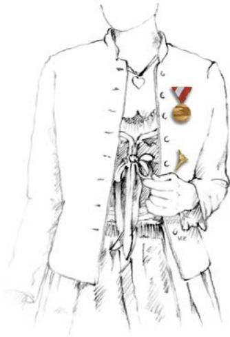
Abbildung 3: Brust- und Steckdekorationen