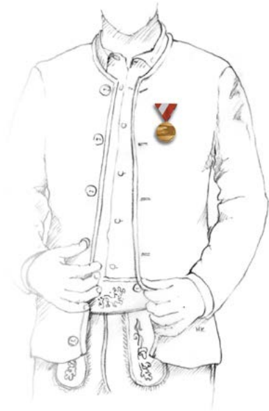
Abbildung 1: Brustdekoration