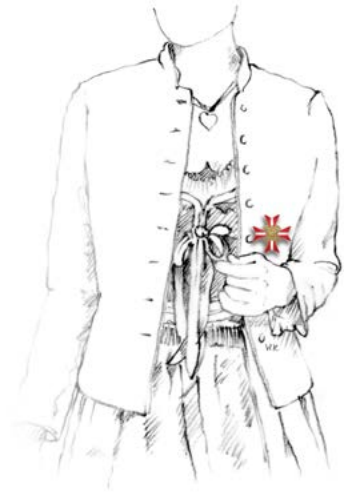
Abbildung 2: Steckdekoration