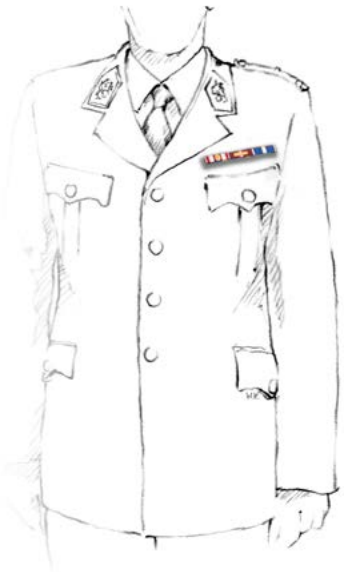
Abbildung 4: Ordensspange